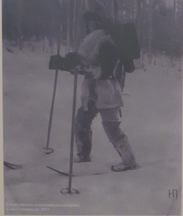
Озеление Восточная Сибирь, Якутская обл., Якутский округ нач. XX в. Валу