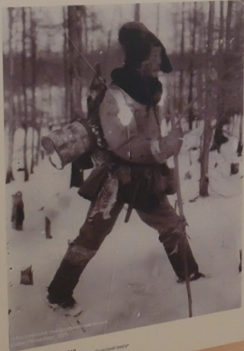
Возвращение с промысла Восточная Сибирь, Якутская обл., Якутский округ нач. XX в. Валу