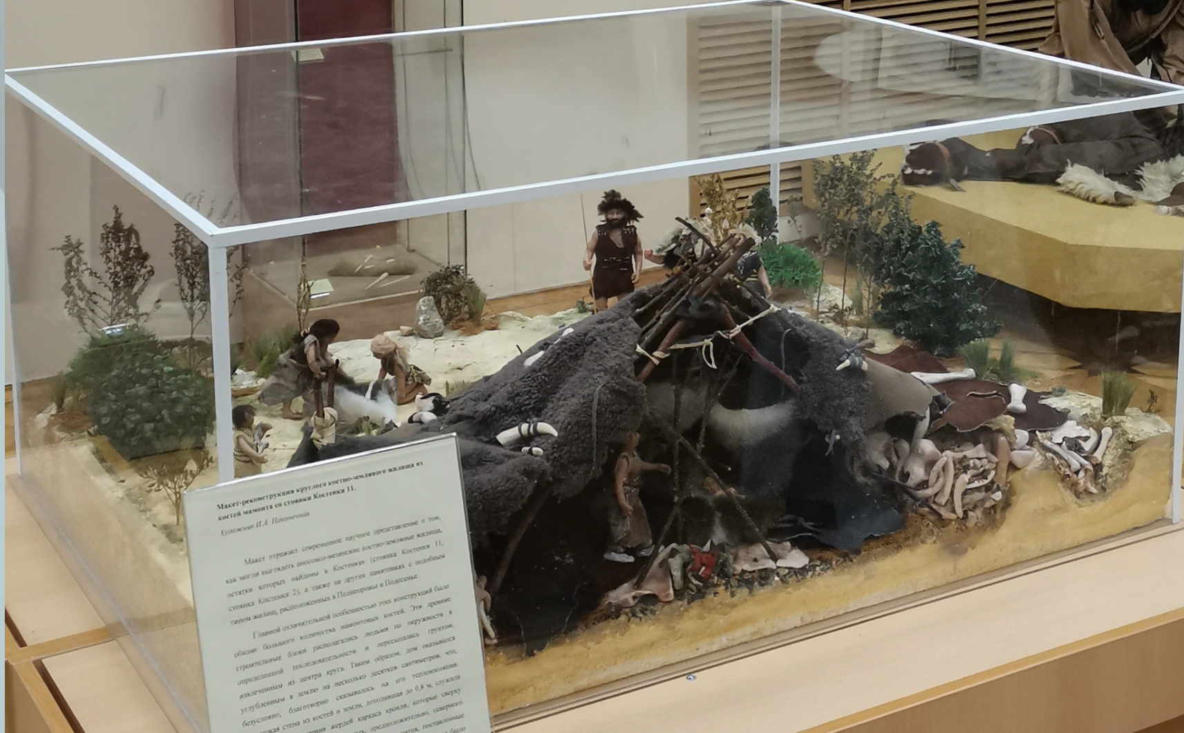
Масштабная реконструкция круглого жилища мамонта из костей мамонта со стоянки Костенки 11. Художник И.А. Панченко