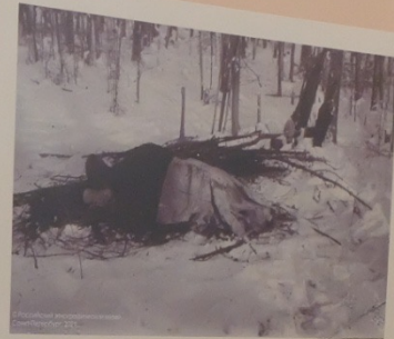
Стань оленями во время грозы Восточная Сибирь, Якутская обл., Якутский округ нач. XX в. Валу