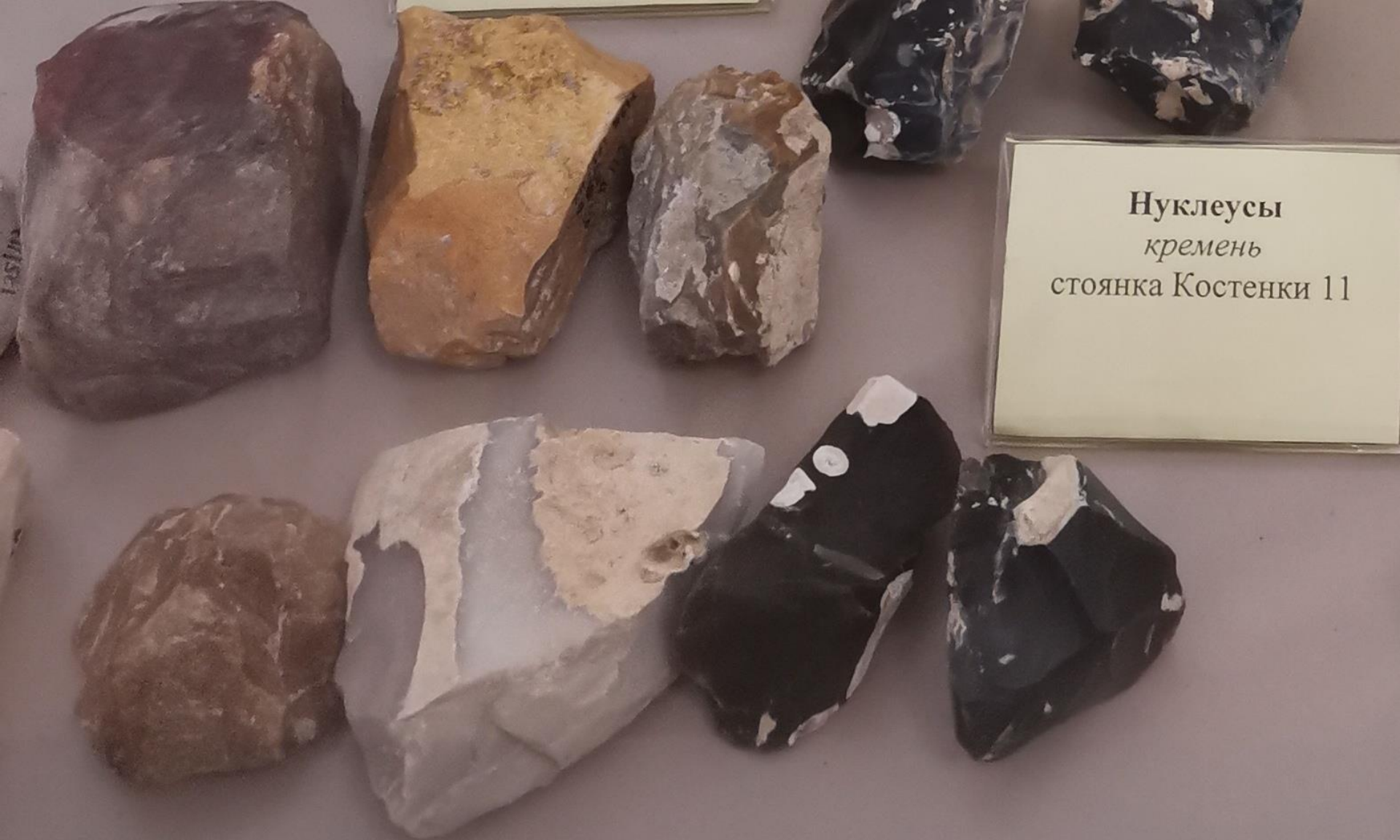
Нуклеусы кремь стоянка Костенки 11

Сегодня мы с вами поговорим об охотничьем вооружении эпохи каменного века. Но, прежде чем речь пойдёт о самих орудиях, скажем пару слов о том, как их изготавливали. Перед вами находятся нуклеусы – это каменные ядрища из которых делались заготовки для будущих орудий.