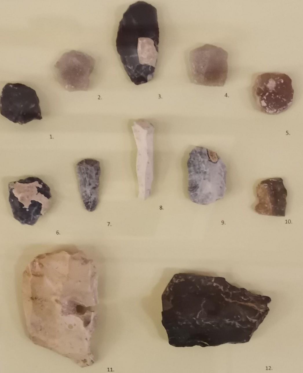
1 – 10 Скребки 11 – 12 Скребла кварцит, кремнь стоянка Костенки 11

А сейчас мы с вами поговорим о самой разнообразной по своему виду и применению в быту группе орудий – скребки. Их делали из обломков пластин. Рабочему краю придавали несколько дугообразную форму и заостряли грань. Такими инструментами обрабатывали шкуры, выскабливая остатки жира и мышечных волокон. Но так же, скребки могли использоваться и для обработки кости, рога или дерева. Это один из самых универсальных инструментов каменного века!