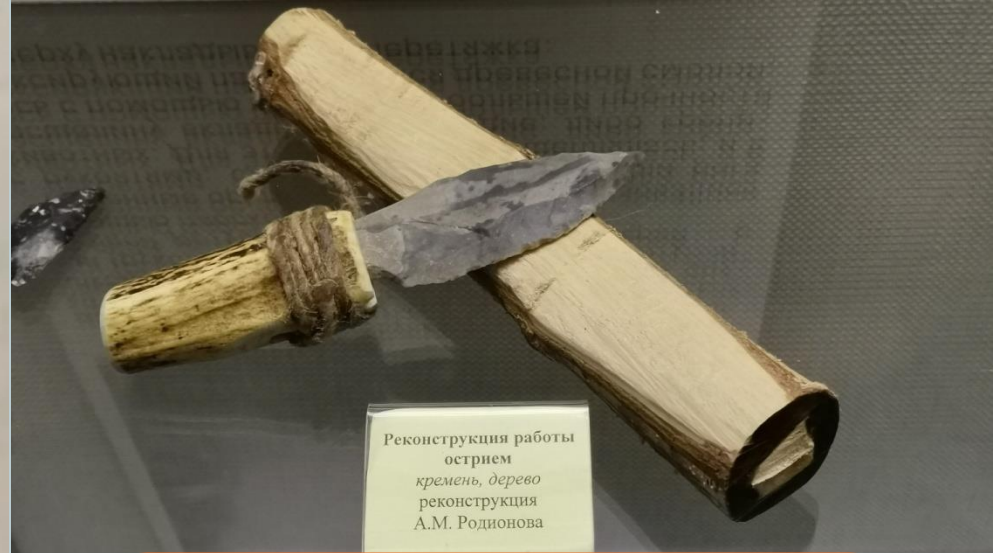
Реконструкция работы острием кремень, дерево реконструкция А.М. Родионова

Первое орудие, которое мы с вами рассмотрим, называется резец. Его название говорит само за себя – им что-то разрезали. Это был незаменимый инструмент на охоте, им свеживали добытого зверя. Иногда для резцов изготавливали рукоятку из кожи или рога, что делало орудие более удобным. Перед вами пример резца с рукоятью из рога оленя. Как видите, он приобрёл схожую с ножом форму. Кстати, из-за того, что кремнь намного прочнее стали, такие каменные ножи тупятся гораздо медленнее.