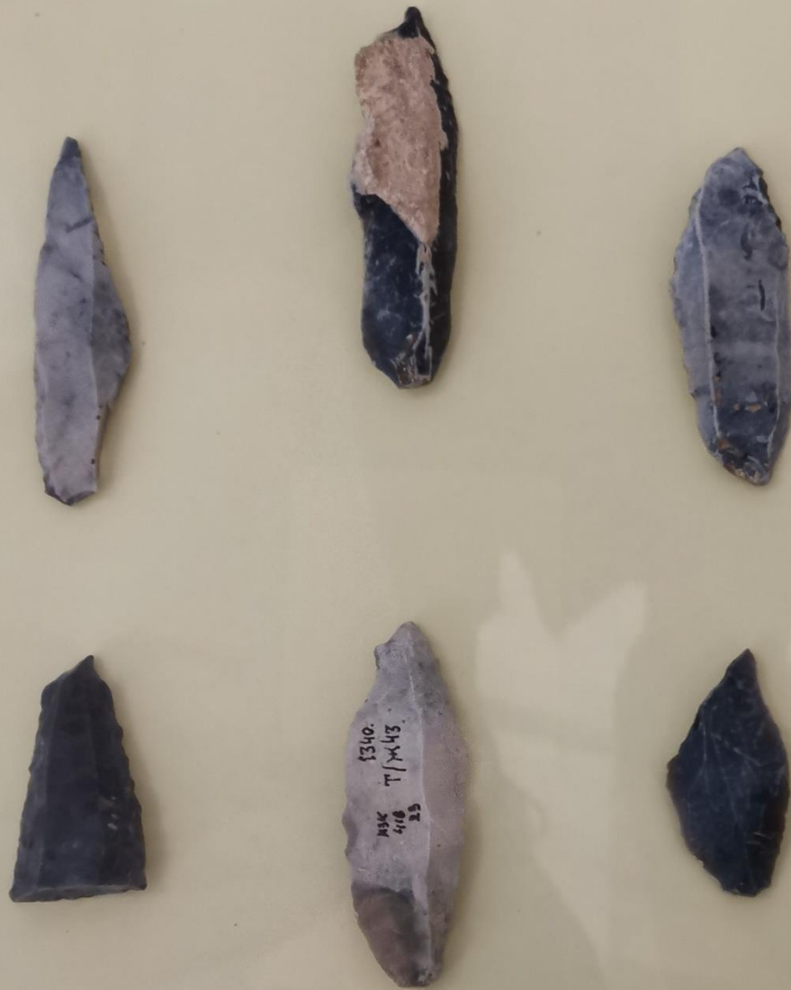
Острия кремень стоянка Костенки 11

Теперь давайте посмотрим на острия. Это орудие имеет заострённый конец. Как правило, они служили наконечниками для метательных снарядов и копий. Если внимательно посмотреть на эти острия, можно увидеть прямые сколы от тупого к острому краю.