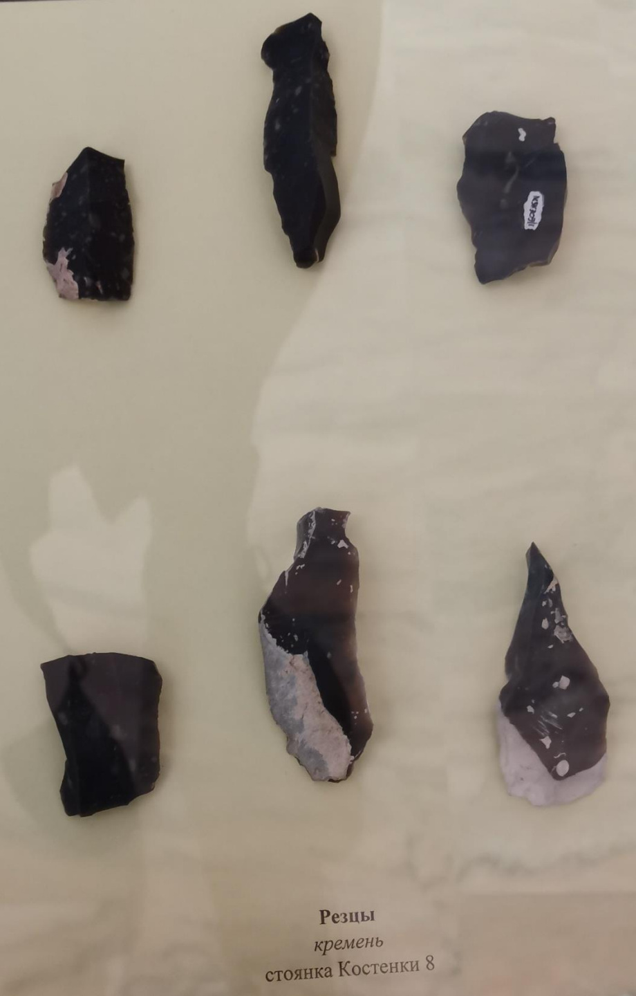
Резцы кремень стоянка Костенки 8